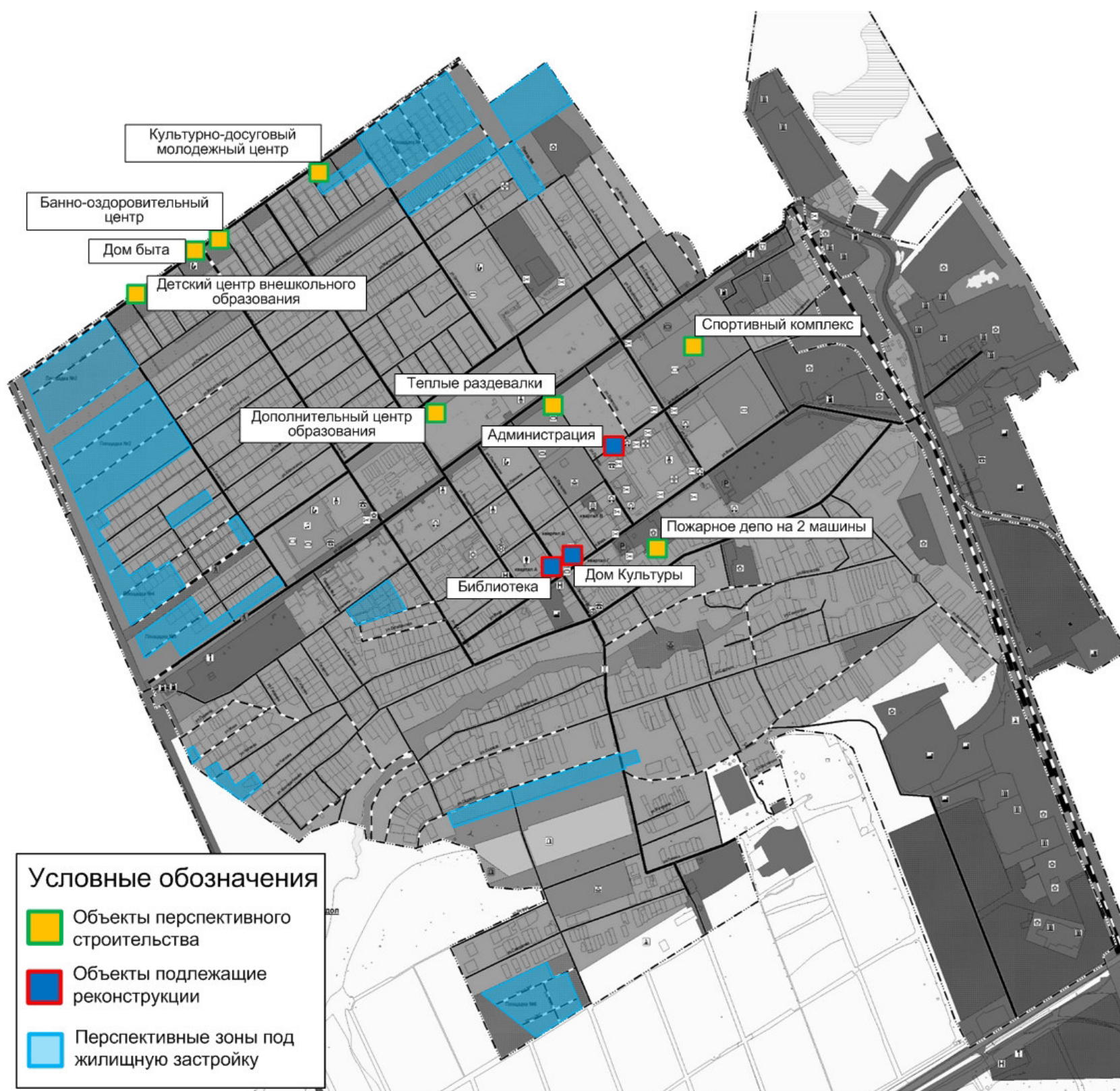
Рисунок 1.1.1 – Территория п.г.т. Суходол с площадками под жилую зону и выделенными объектами перспективного строительства и реконструкции