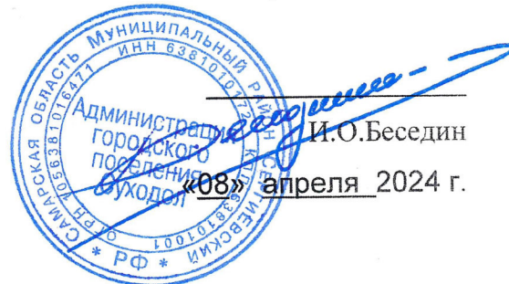
СХЕМА ТЕПЛОСНАБЖЕНИЯ (АКТУАЛИЗАЦИЯ) ГОРОДСКОГО ПОСЕЛЕНИЯ СУХОДОЛ МУНИЦИПАЛЬНОГО РАЙОНА СЕРГИЕВСКИЙ САМАРСКОЙ ОБЛАСТИ НА ПЕРИОД С 2021 ДО 2033 ГОДА (актуализация на 2025 год)

УТВЕРЖДАЮ» Глава г.п. Суходол муниципального района Сергиевский Самарской области