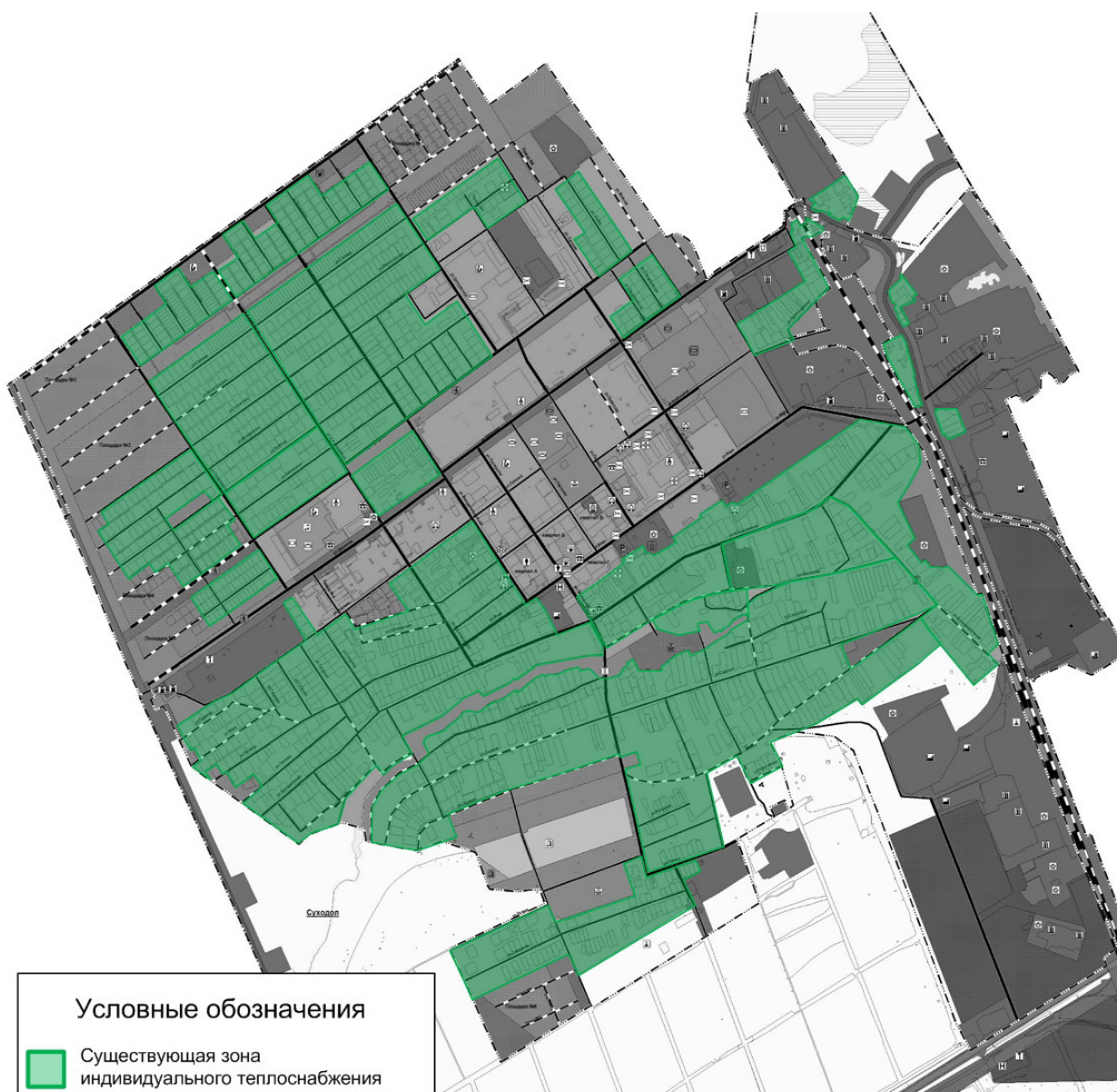
Рисунок 2.3.1 – Существующие зоны действия индивидуальных источников тепловой энергии п.г.т. Суходол