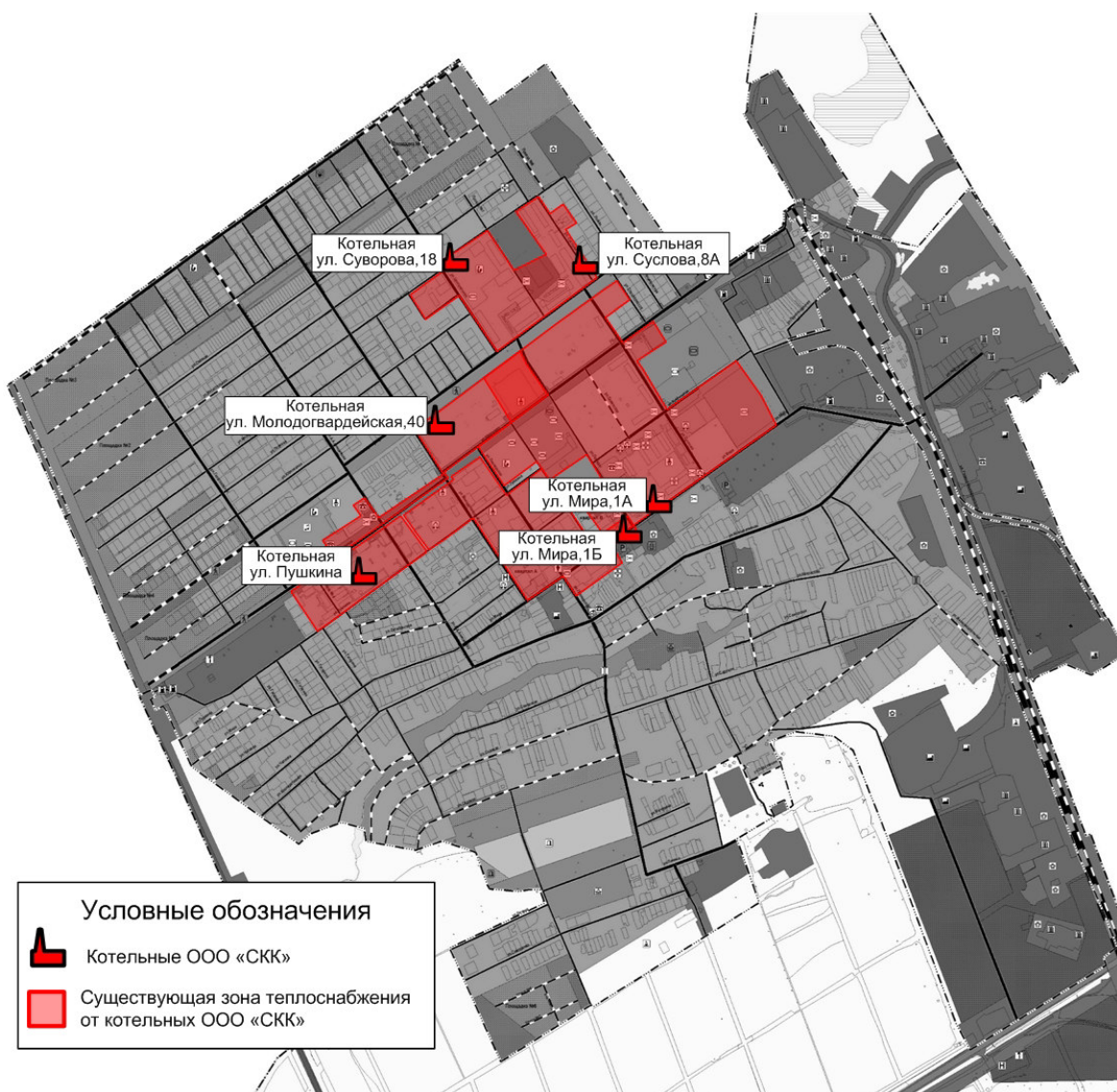
Рисунок 2.2.1 – Зоны теплоснабжения существующих котельных, действующих на территории п.г.т. Суходол